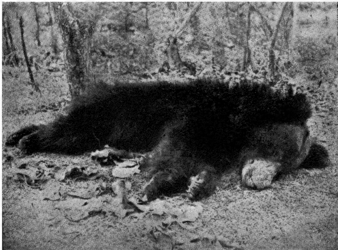
रीछ ( भालू )